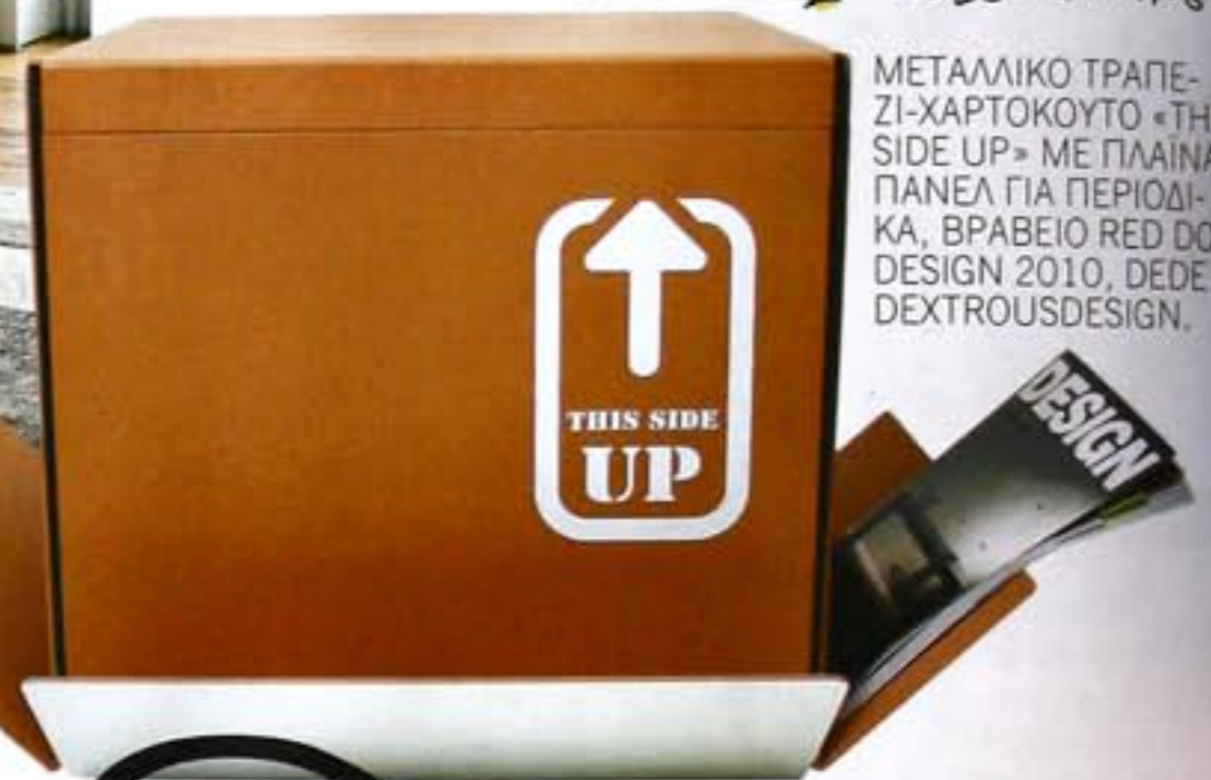
ΜΕΤΑΛΛΙΚΟ ΤΡΑΠΕΖΙ-ΧΑΡΤΟΚΟΥΤΟ «THIS SIDE UP» ΜΕ ΠΛΑΙΝΑ ΠΑΝΕΛ ΓΙΑ ΠΕΡΙΟΔΙΚΑ, ΒΡΑΒΕΙΟ RED DOT DESIGN 2010, DEDE DEXTRIOUSDESIGN.