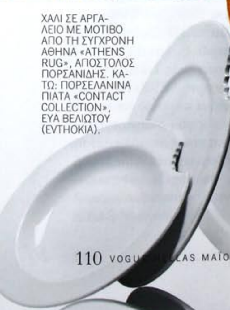
ΧΑΛΙ ΣΕ ΑΡΓΑΛΕΙΟ ΜΕ ΜΟΤΙΒΟ ΑΠΟ ΤΗ ΣΥΓΧΡΟΝΗ ΑΘΗΝΑ «ATHENS RUG», ΑΠΟΣΤΟΛΟΣ ΠΟΡΣΑΝΙΔΗΣ. ΚΑΤΩ: ΠΟΡΣΕΛΑΝΙΝΑ ΠΙΑΤΑ «CONTACT COLLECTION», ΕΥΑ ΒΕΛΙΩΤΟΥ (ΕΝΤΗΟΚΙΑ).