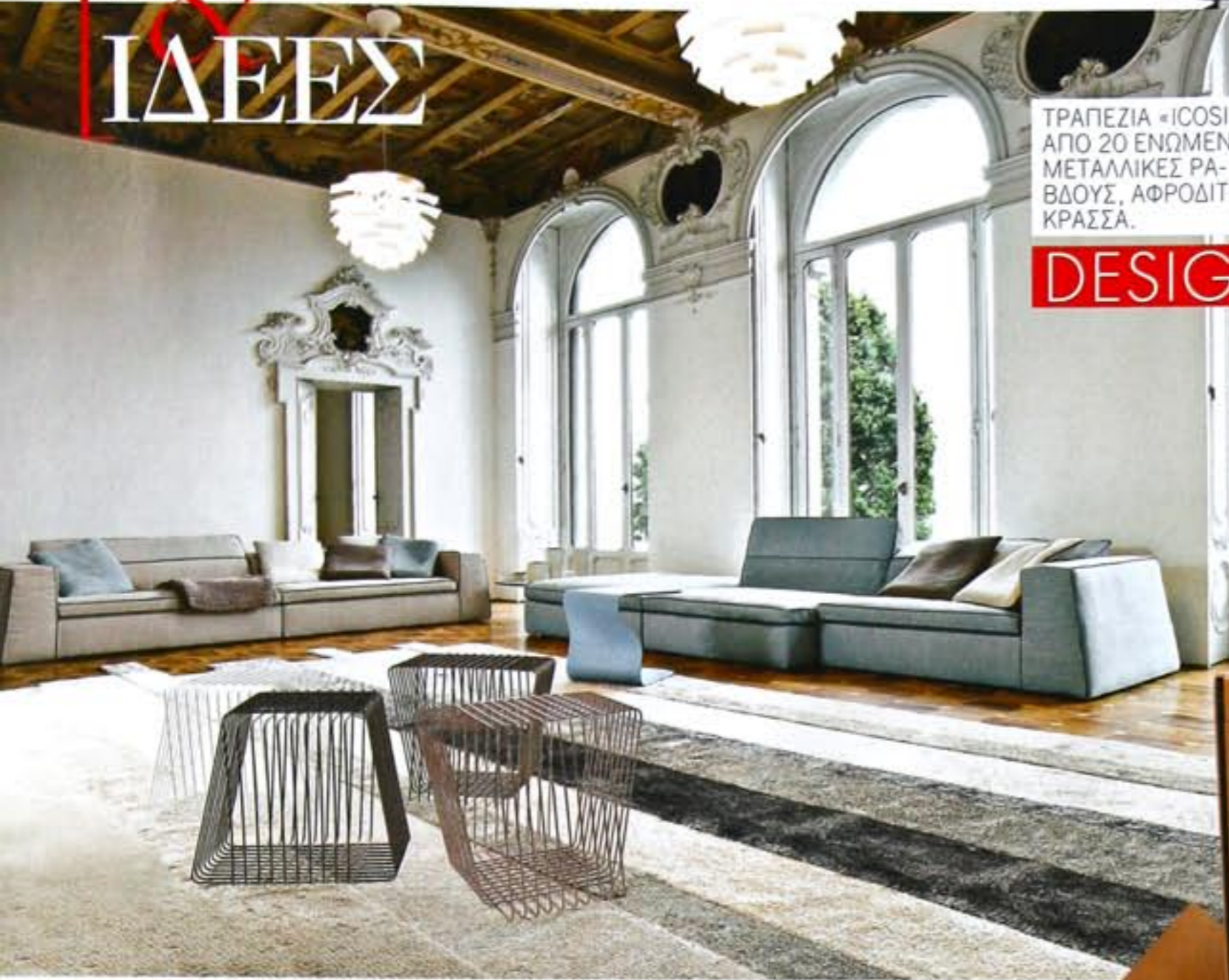
ΤΡΑΠΕΖΙΑ «ICOSI» ΑΠΟ 20 ΕΝΩΜΕΝΕΣ ΜΕΤΑΛΛΙΚΕΣ ΡΑΒΔΟΥΣ, ΑΦΡΟΔΙΤΗ ΚΡΑΣΣΑ.