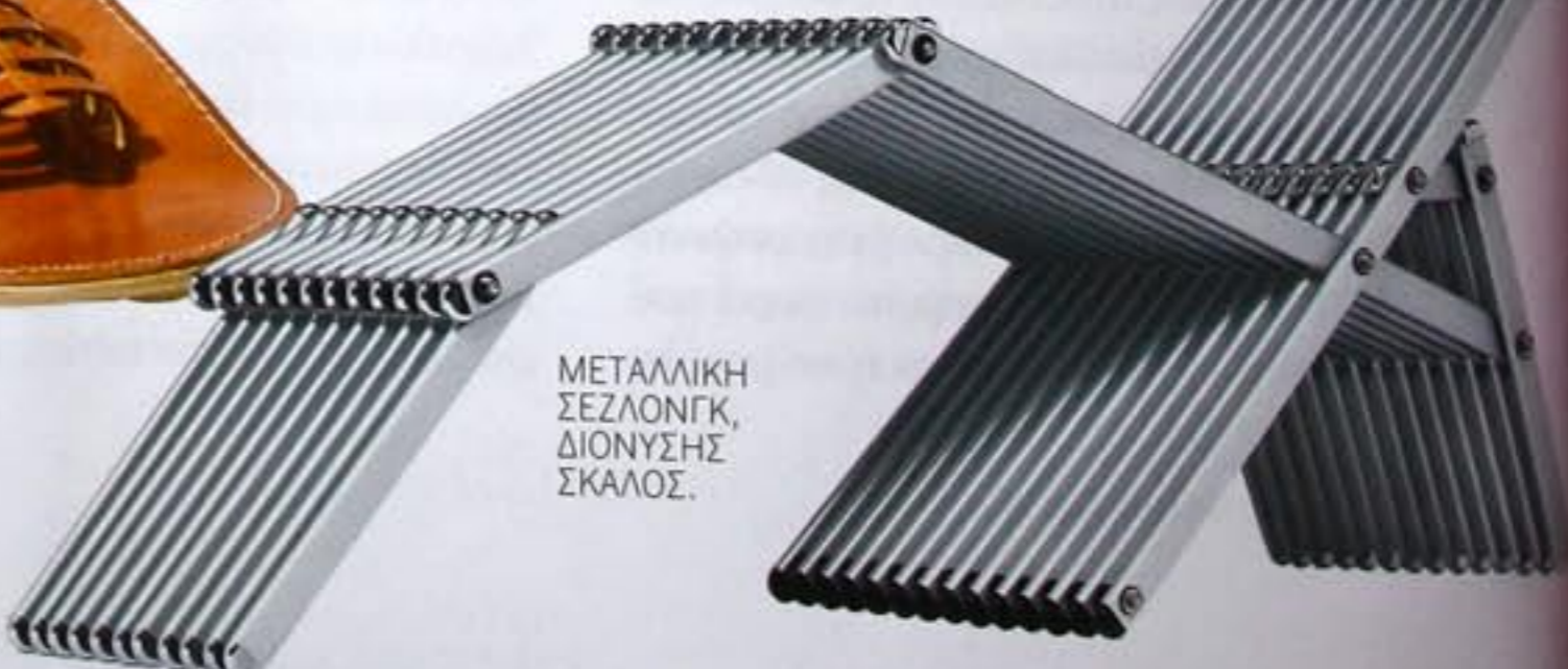
ΜΕΤΑΛΛΙΚΗ ΣΕΖΛΟΝΓΚ, ΔΙΟΝΥΣΗΣ ΣΚΑΛΟΣ.